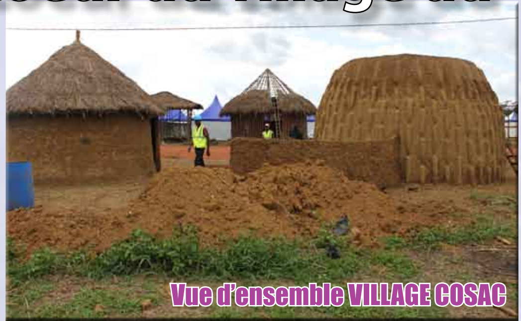
Vue d'ensemble VILLAGE COSAC