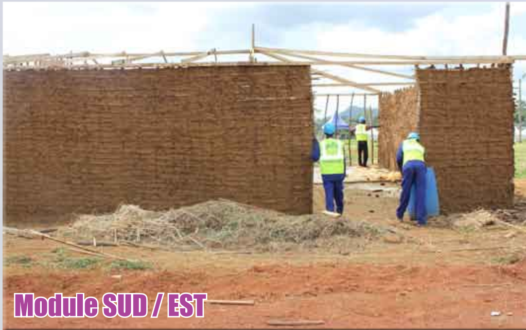
Module SUD / EST