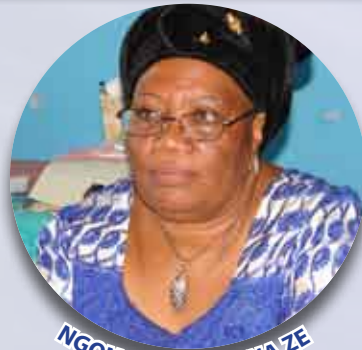
NGONO NKOMO NNA ZE